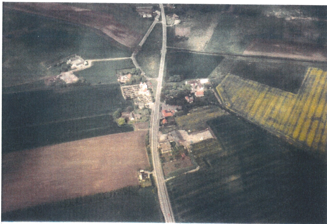
Luffoto af Tuse med frugtplantagen nederst i højre side. Billedet er taget i 1977.