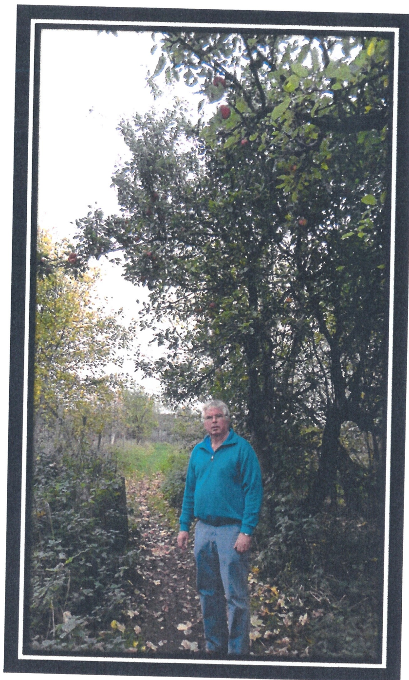
Et vemodigt gensyn med plantagen 30 år efter.