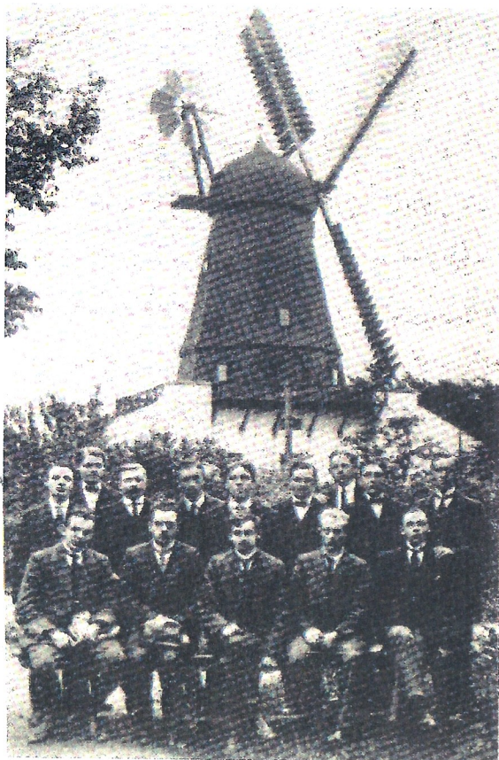
Forsøgsmøllen ved Askov Højskole.