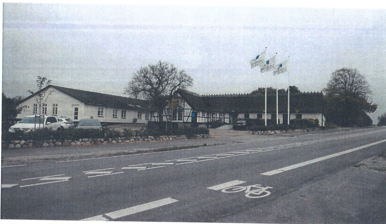
Gården anno 2015.