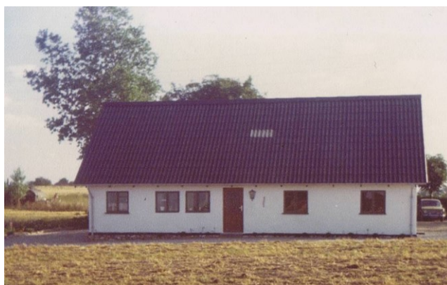
Foto fra 1975

I dag hedder disse huse stadig i folkemunde nr.8-husene, men adressen er: Butterupvej, 4420 Regstrup.