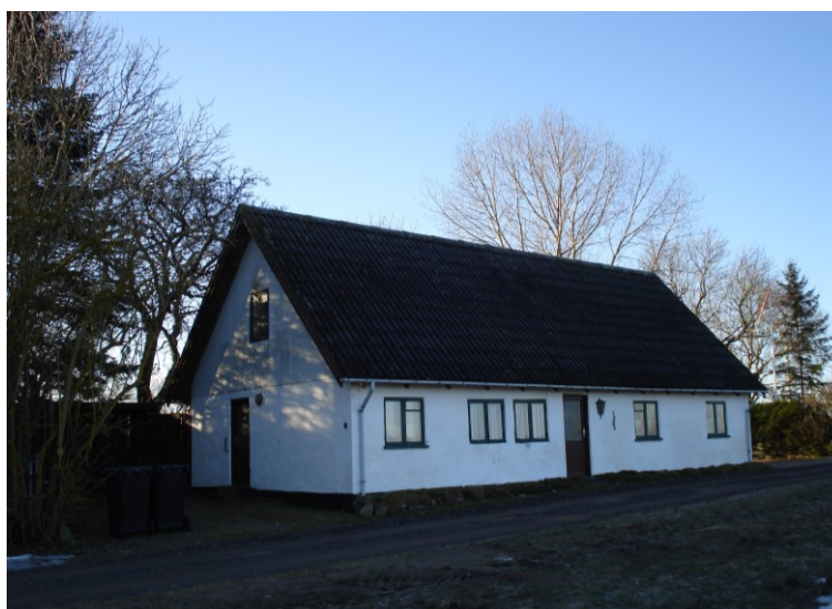
Butterupvej 70. Foto 2011 (Erling Knudsen)

Huset blev købt af den nuværende ejers svigerforældre i 1930, hvor Løvenborg hovedgård udstykkede og solgte nr. 8-husene.