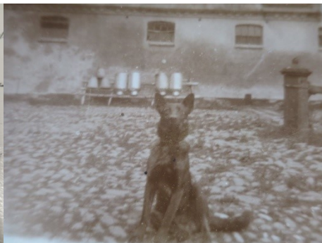
Gårdsplads på Vestervang m/gl.vandpump