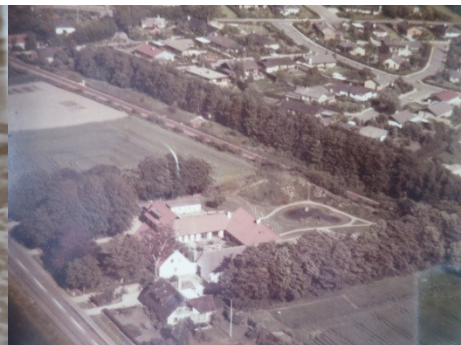
"Vestervang" i 80'erne. Med Vestervangen øverst.