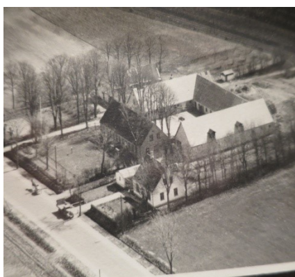
"Vestervang" fra før 1960