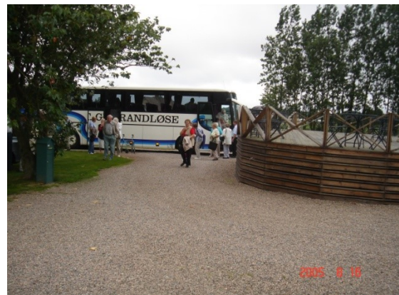
Foto fra møde i pensionistforeningen og fra en udflugt