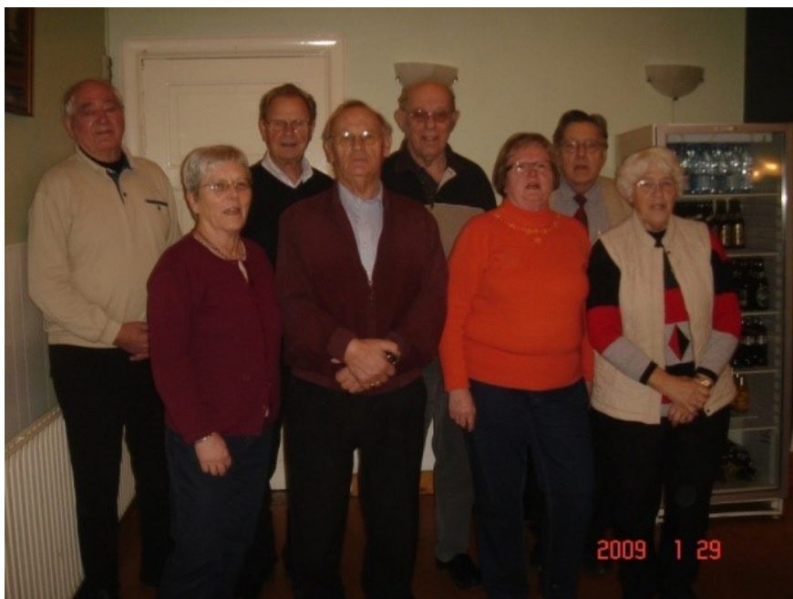
Nuværende bestyrelse (januar 2009).