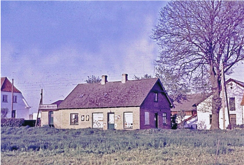
Forretningen med Høj møllehus til venstre og Mølle- gården til højre. Motormøllen var placeret i en tilbygning på den nordlige del af huset. Foto midt i 1960'erne.