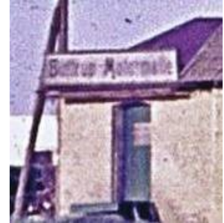
Nærbillede af skiltet "Butterup Motormølle" over døren til tilbygningen