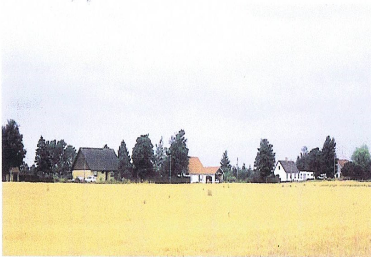
Den næste generation af huse opstod efter husmandsloven af 1899. Normalt er de placeret samlet i udkanten af de gamle hovedgårdsmarker. Da der ikke var bygningsmæssige begrænsninger ud over økonomien, er det placeringen, som karakteriserer dem. Udstykningen ved Eriksholmvej syd for Nyvang er nok den mest interessante, men denne lille husrække syd for Butterup viser bedre i et enkelt billede de karakteristiske træk.