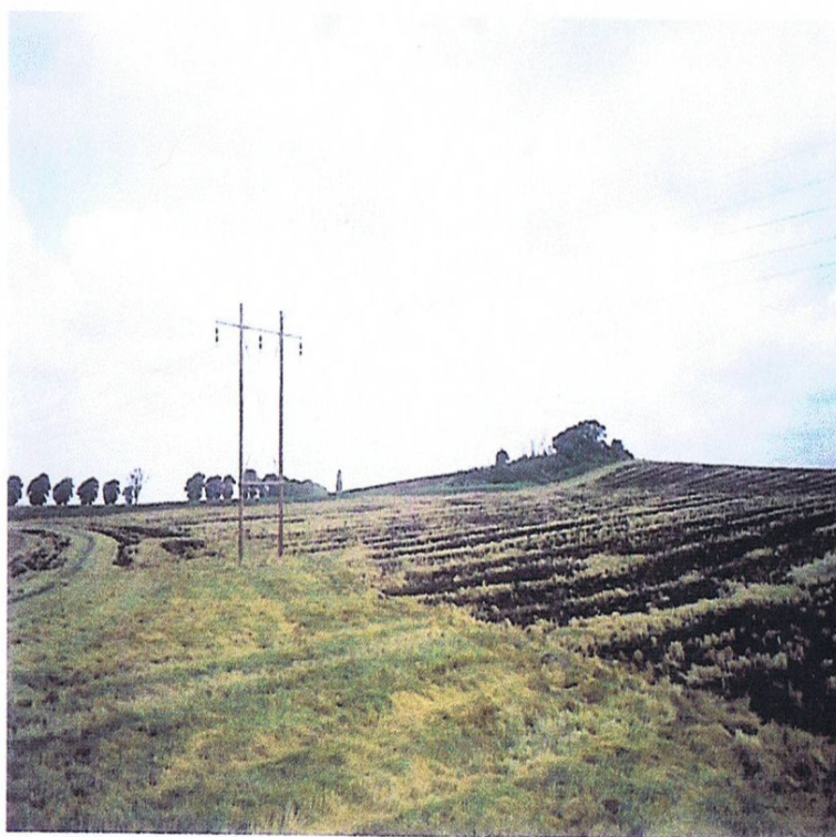
Godsets første store påvirkning af landskabet var landsbynedlæggelserne. På denne mark nord for Løvenborg har landsbyen Ellinge ligget. Der blev i flere omgange nedlagt gårde i landsbyen, til den endelig blev nedlagt 1693. Markerne her bærer stadig Ellingenavnet.

Normalt hørte der skove til en hovedgård, og Løvenborg var ingen undtagelse. Der var den store Fledskov og de mindre Syvendeskov og Ubberup skov. Normalt ejede et gods overskoven (de høje træer til tømmer) og jorden (til olden til svin), mens bønderne ofte (men ikke her) havde ret til