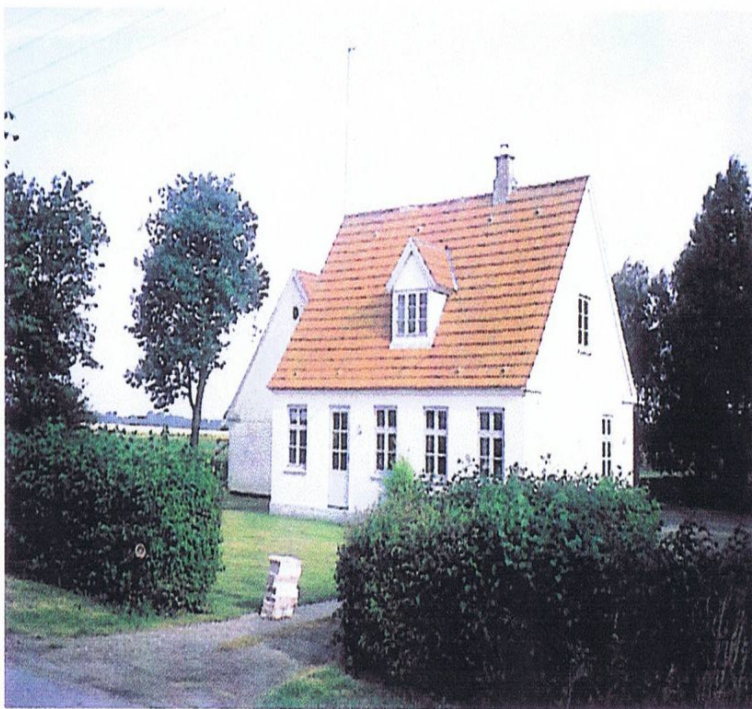
Placeringen og ensartetheden i arkitektur og bygningsstørrelse er karakteristisk for statshusmandsbrugene efter 1919-lovgivningen. Med en centralistisk holdning mindende om Sovjets fastlagdes arkitektur, størrelse og indretning af bygningerne. Men de ser godt ud i landskabet, og man føler sig meget dansk. Et klassisk eksempel er Løvenborg Allé 2, som er model for statshusmandsbruget på Nyvang. Men også på Løvenborg Allé er mange af brugene ændret meget gennem tiden.

det ene af palæerne ved Amalienborg (det nuværende Christian IXs palæ), men det oversteg baroniets kræfter, og han mageskiftede det til et mindre ved Holmens Kanal.