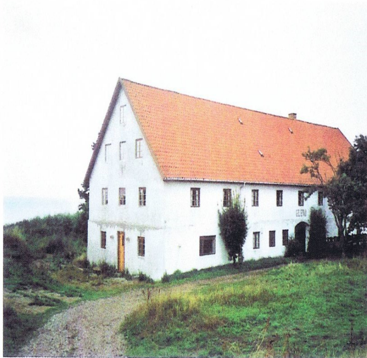
I modsætning til landbefolkningen i øvrigt kunne godsejeren selv drive udenlandshandel med egne produkter, og de fleste godsejere stod selv for eksporten, først af stude, derefter af korn. For Løvenborgs vedkommende gik handelen over Holbæk, men mere kystnære godser kunne selv have en havneplads, f.eks. Eriksholm. Med den store eksport af korn i midten af 1800-tallet opførte Dragsholm dette kornmagasin ved Havnsø.

Baroniet havde også birkeret, d.v.s. at baroniets ejendom ud-