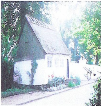
Godsejeren var som faderen, der måtte tage sig af sine børn. For de gamle, som havde levet ordentligt og sædeligt, kunne han oprette milde stiftelser og asyl. I kirkegårdsmuren ved Butterup Kirke er før 1798 opført et asyl.