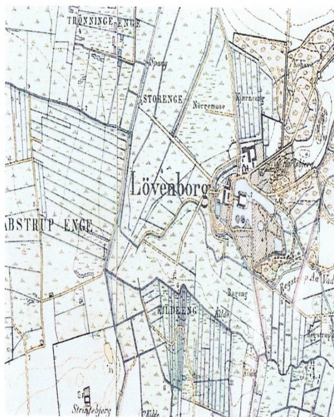
Løvenborg ligger nærmest på en halv omgivet af enge. Placeringen understreges af, at der mod "landsiden" er skov. Den oprindelige hovedgård, Ellinge, lå sammen med landsbyen af samme navn på agerjorden mellem de nuværende bygninger og Ellinge Enghave mod nord. Kort fra 1894. Copyright Kort- & Matrikelstyrelsen.

Placeringen og funktionen af hovedbygningerne varierede over tiden. De ældste godser havde