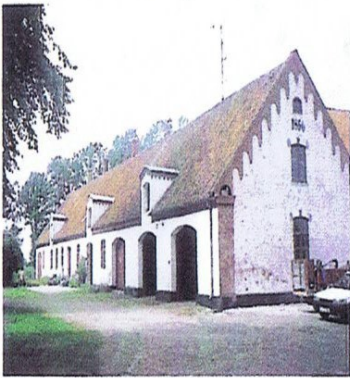
De fleste steder er sammensætningen af godsets avlsbygninger præget af højkonjunkturer inden for kornavlens, bl.a. ca. 1840-70. Det gælder også Løvenborg, hvor de viste er fra 1856. Avlsbygningerne er vigtige, når man skal beskrive produktionen gennem tiderne.

funktion som borg, og ved flere ses voldsteder. Med krudtets komme veg befæstningen til fordel for mere repræsentative bygninger, hvilket kan ses på Løvenborgs vinduespartier, hvis placering tæt ved jorden afspejler, at forsvarsfunktionerne alligevel var forsvundne. Karakteristisk for ældre godser er også placeringen tæt på større engområder, for langt op mod 1700-tallet var studeavlen den vigtigste – Løvenborg ligger på en halvø ud mod store engarealer. Senere godsanlæg tog ved placeringen mere hensyn til kornavlens. Bevarelsen af engarealerne er derfor ikke uvæsentlig.