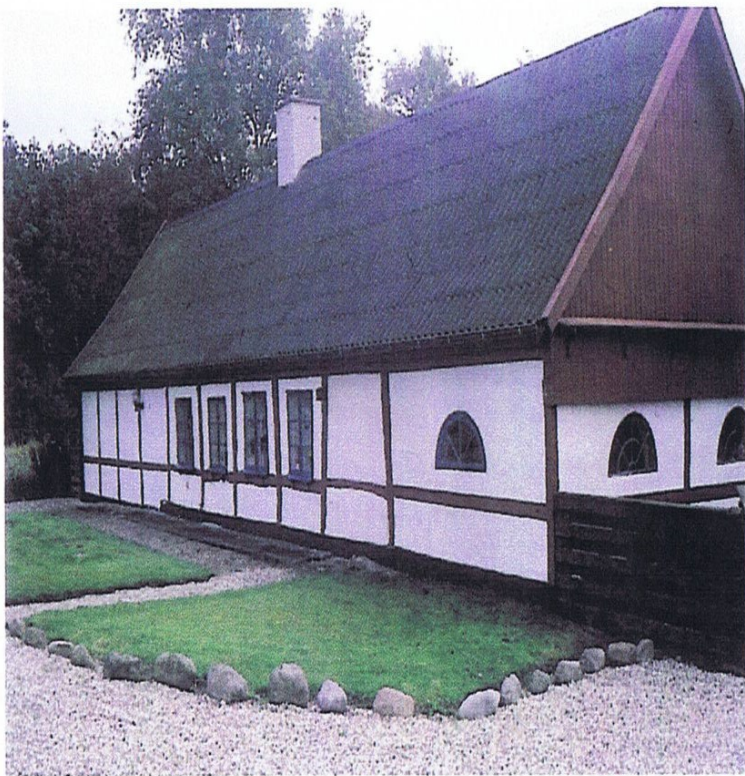
En del godser markerede deres huse og gårde med farver. Tidspunktet for dette er varierende og det er svært at præcisere, hvor langt tilbage i tiden dette går, for på Sjælland var det skik at kalle tømmere over, og det svarer i hvert fald ikke til de eksempler, vi kender i dag. På Astrup er der rød farve med hvide vinduer, på Torbenfeld er der gule sten og grønne vinduer, og her på Tømmerupvej under Kongsdal er der hvide vægge, rødt tømmer og blå vinduer.

gjorde en selvstændig retskreds, Løvenborg Birk, hvor baronen udnævnte birkedommeren (som både var dommer og politimyndighed). Til mange birker hørte et tinghus, men det kendes ikke for Løvenborg birk. Måske har man holdt retten i en af Løvenborgs bygninger.