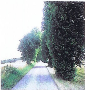
For at understrege hovedgårdens betydning og forskønne landskabet leder alleer op til anlægget. På Løvenborg er den ene, Løvenborg Allé, bukket under for elmesygen og genplantet. Den anden, mod Trønninge, står endnu flot de fleste steder.

Godset havde også flere kulturelle og sociale dimensioner. Den mest oplagte er ved Løvenborg anlæggene med den geometrisk ordnede have, som nås fra hovedbygningen via en gangbro over voldgraven. På den anden side, i skoven, indrettede Carl Lø-