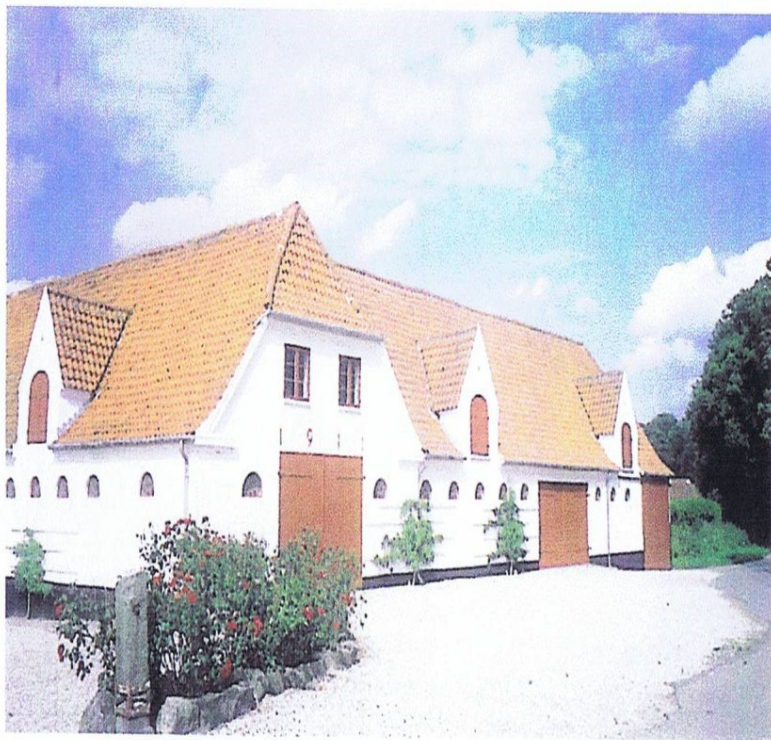
På Løvenborg var der som nævnt stor byggeaktivitet i begyndelsen af 1900-tallet, hvor blandt andre disse smukke avlsbygninger kom i 1911.

rum, som har skabt relationer beboerne imellem, på samme måde som landsbyen skabte det. Lidt af det kan vi dog se. På nogle godser bliver bygningerne, også de fjernere liggende, stadig malet i for det enkelte gods karakteristiske farver – vi har f.eks. for Kongsdal hvide vægge, rødt bindingsværk og blå vinduer. Hvor meget der er kommet, efter at man har ophørt med at overkalke bindingsværket, og hvor meget der var før, vides ikke. Det viser lidt af udstrækningen og siger mere om bevidstheden. I disse år, hvor ejendommene sælges fra, vil de nye ejere selvfølgelig selv bestemme farverne. Så dette smukke træk er i langsom opløsning.