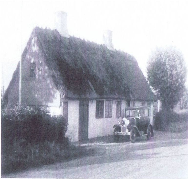
Flere skoler opførtes på Løvenborgs godsområde som følge af baroniets skolereglement af 1797. Hanerup gamle skole lå nord for Skovvejen ud for vejen til Bankehusene, i skellet mellem Hanerup-Dramstrup og Nr.Jernløse. Den blev nedlagt som skole 1832 og nedrevet i forbindelse med anlæggelsen af Skovvejen 1955.