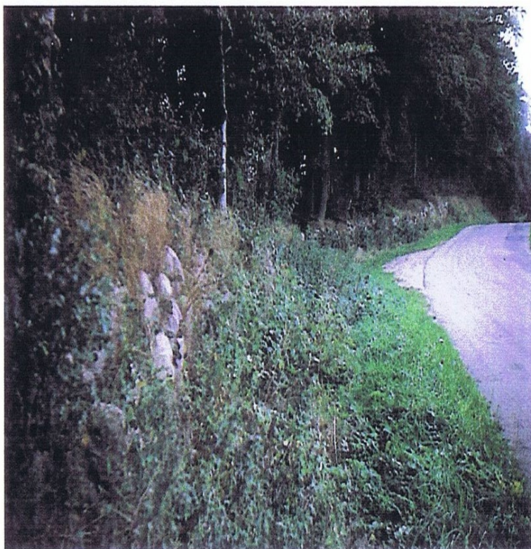
Det tidlige 1700-tals skovlandskab var præget af en ubestemt overgang mellem ager, skov og krat. Nye forstmetoder sluttende med skovforordningen af 1805 bevirkede, at skoven fik en skarp grænse, som yderligere blev forstærket af indhegning. Da det næsten altid var godsejerne, som ejede skoven, var det deres forstpolitik, som var grundlag for skovens udseende. Dette smukke skovdige hører til Merløsegårds skove ved Ordrup.

af en gårds lod, således der til hver gård ligger et hus i nærheden, eller – og det var karakteristisk for Løvenborg – husene ligger i kolonier. Bestemmende for deres placering var tæthed til hovmarkerne (hvor husmændene havde deres hovedarbejdsplads) og/eller den dårlige jord yderst i landsbyens marker. Møsthusene i Butterup, Tuse Huse og Nordenskov i Tuse, Kolonihusene i Kundby samt Mårsø Huse i Mårsø er eksempler herpå.