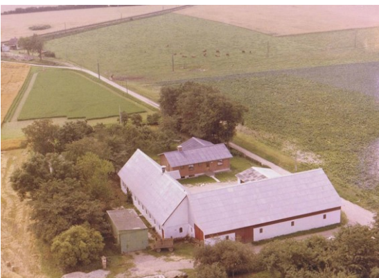
Foto efter genopførelsen i 1965

I 1950'erne var besætningen på 4 heste, 14 køer og 11 ungkreaturer af RDM samt 20 svin.