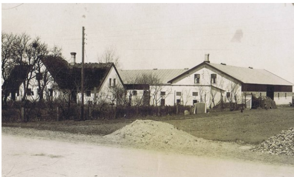
Gården 1917 – bemærk el-masten