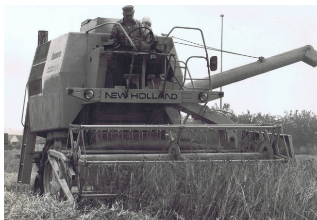
Torben på mejetærskeren i 1963.

Kørerne blev solgt og gården drevet med svine- og planteproduktion.