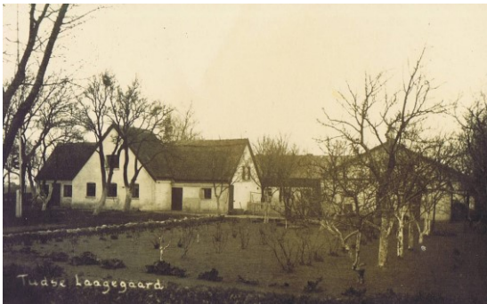
Efter ombygningen i 1905