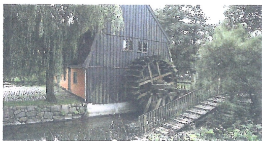
Hvordan Tuse Vandmølle har set ud vides ikke, men muligvis som på dette foto hentet fra Internettet!

I de efterfølgende mange år var der skiftende møllere, men ingen klarede sig særlig godt. Flere gange forfaldt møllen og i 1761 blev den endelig nedlagt efter at have fungeret mere eller mindre godt i omkring 200 år.