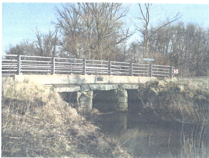
Foto 1984 (Årbog for Historisk Samfund for Holbæk Amt årgang 1984)

Ligger hvor Trønninge Allé går over i Lodskovvej.