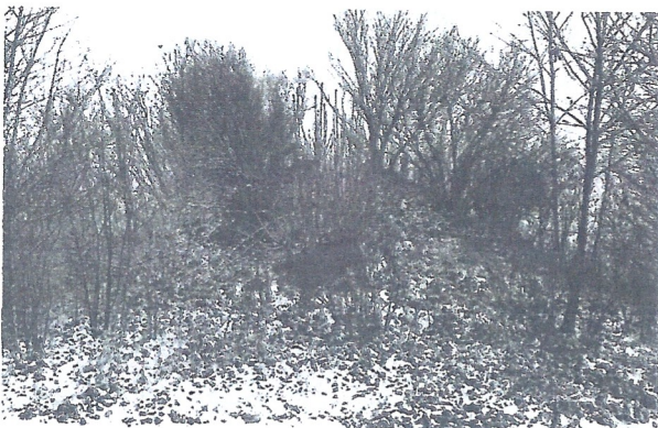
I haven på Tuse Bjerg nr. 2

Eksempler på eksisterende gravhøje i Butterup-Tuse sogne