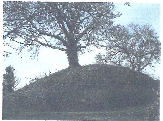
I haven på Kalundborg nr. 222