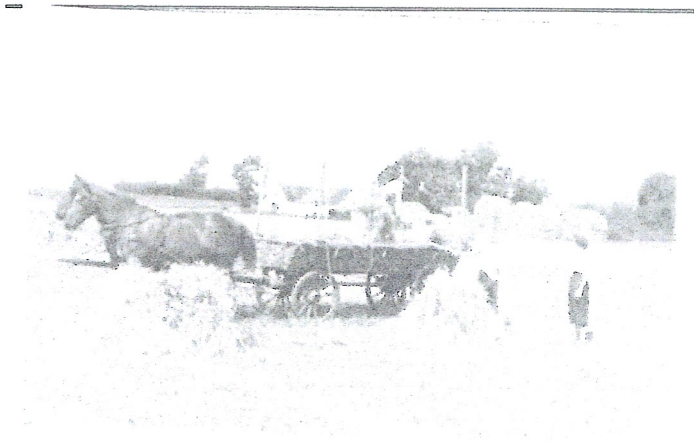
Høstbillede fra 1950'erne

Holger fra Nr. 8-husene (se beskrivelsen) var karl hos Christian. Holger blev altid kaldt vor Holger .