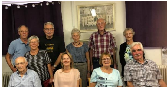
Bestyrelsen i Butterup-Tuse Lokalhistoriske Forening. (aug. 2020)